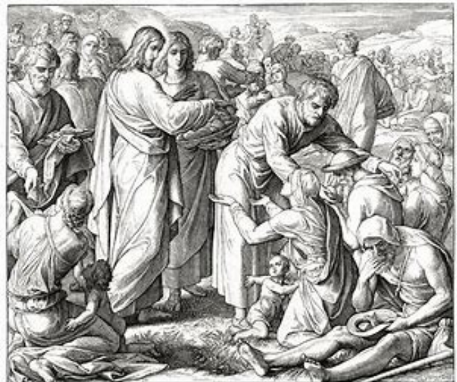
Wunderbare Erhaltung des Brotes.

Jesus also took bread, and he said to the disciples, He said also to the multitude, Sit down, and eat, and drink, and be filled, and they ate and were filled, and they glorified God, and said, This is a great sign, for we had seen Jesus do this before.